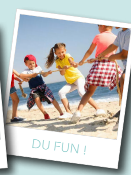
DU FUN !