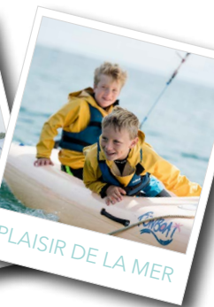
PLAISIR DE LA MER