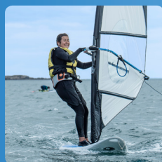
Planche à voile 10 ans et +

Floteurs de nouvelle génération avec stabilité maximale pour glisser et prendre du plaisir dès le premier jour.